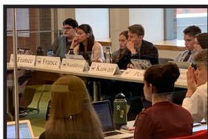
Los alumnos de la Eugene IHS asisten a la conferencia Modelo de las Naciones Unidas