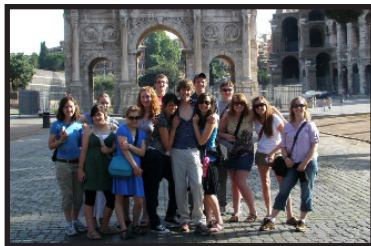
Los alumnos de la Eugene IHS visitan Roma

Desde su establecimiento en 1984, la Preparatoria Internacional de Eugene (Eugene IHS por sus siglas en inglés) ha sido una escuela alternativa galardonada en estudios internacionales para alumnos del noveno a doceavo grado. La escuela está diseñada para alumnos quienes valoran la comprensión y comunicación global, diferencias culturales y el mejoramiento de la condición humana. Eugene IHS ofrece un plan de estudios interdisciplinario en humanidades de cuatro años que se concentra en el estudio de las naciones, sus culturas, historia, expresión artística y los sistemas políticos, económicos y de creencias. Los alumnos que se gradúan de la preparatoria de Eugene IHS, habrán desarrollado un conocimiento cultural necesario para lograr una comunicación y entendimiento internacional.