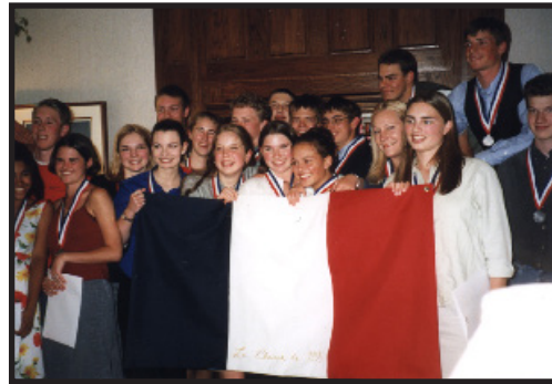
Eugene IHS ofrece programas de inmersión en francés y español