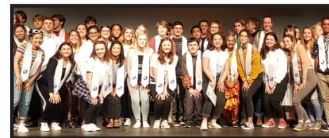
Los candidatos para recibir el Diploma de Bachillerato Internacional reciben sus honores con una estola al final de su último año de educación

La Eugene IHS es miembro del Programa de Bachillerato Internacional, una afiliación de escuelas a nivel mundial que fomenta los estándares internacionales de rendimiento. Todos los cursos de los alumnos de primero y último año de la Eugene IHS cumplen los requisitos del IB (Bachillerato Internacional). Los alumnos de la Eugene IHS pueden decidir obtener el Diploma completo de IB tomando exámenes en seis materias o tomar pruebas como candidatos de cursos en materias individuales. Pasar las pruebas de IB pueden darles a los alumnos créditos en universidades y centros de educación superior en todo el mundo. Para ver más información sobre el Programa de Diploma de IB, visite el sitio web del Organismo de Bachillerato Internacional: www.ibo.org .